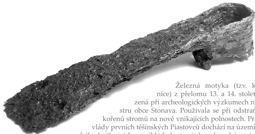
Železná motyka (tzv. ključovnice) z přelomu 13. a 14. století nalezená při archeologických výzkumech na katastru obce Stonava. Používala se při odstraňování kořenů stromů na nově vnikajících polnostech. Právě za vlády prvních těšínských Piastovců dochází na území Těšínského knížectví k rozsáhlé kolonizaci dosud neobývaných končin. S tím souvisí i vznik několika desítek nových osad a vsí.

představy o svrchované panovnické moci praktikované českým a polským vládařem. Jan Lucemburský, jehož rod pocházel z pomezí Říše a Francouzského království, ve své politice hojně využíval západoevropských principů lenního práva, a mohl tak Piastovcům nabídnout právně přijatelnější model české svrchovanosti, než jaký by přineslo respektování autority Vladislava Lokýtky. Složením slibu věrnosti lucemburskému vladaři zůstávala slezským zeměpánům zachována vláda v jejich knížectvích a jejich závazky se odvíjely od zásady věrnosti lennímu pánovi, včetně povinnosti podpory seniora radou a vojenskou pomocí. Odmítnutí pomoci bylo vnímáno jako felonie (tj. zrada leníka). Senior se naopak zavazoval k dodržování práva a spravedlnosti a především k ochraně svých poddaných. Drobní se slezská knížectví získala díky Lucemburkům novou právní formu své existence a vzhledem k mocenské záštitě českého panovníka zůstala vláda v knížectvích, až na výjimky spojené s otázkou dědictví po některé z linií, v rukou stávajících knížecích rodů. Pražský dvůr, udržující těsné kontakty s Francouzským královstvím, italským prostředím i německými oblastmi Říše, navíc piastovská knížata přitahoval i kultivovaným modelem rytířské-dvorské kultury a možností rozvíjení politických kariér ve službách českého krále Jana a později i jeho syna Karla IV.