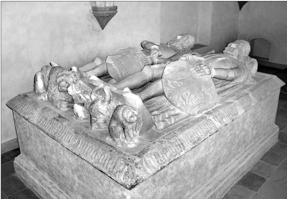
Náhrobek opolských knížat Boleslava I. (+1313) a Boleslava II. (+1356) z kaple sv. Anny z františkánského klášterního kostela v Opolí. Kaple byla vystavěna na začátku 14. století jako rodinná hrobka zdejší linie Piastovců. Náhrobky nechal na paměť svých předků zbudovat před r. 1382 Boleslav III. (+1382), čímž symbolicky odkazoval na starobylost a slávu opolských knížat; r. 2009.

Česko-polská válka z let 1345–1348 tak jen znovu potvrdila rozdělení sfér obou sousedících států na hranicích slezských knížectví a Malo-, popřípadě Velkopolska. Silně urbanizovaná a četnými opevněnými sídly knížat i šlechty vzpíraná oblast Dolního a Horního Slezska znemožňovala dlouhodobější vojenské operace polských vojsk, přičemž mocenská převaha českého krále nad jednotlivými