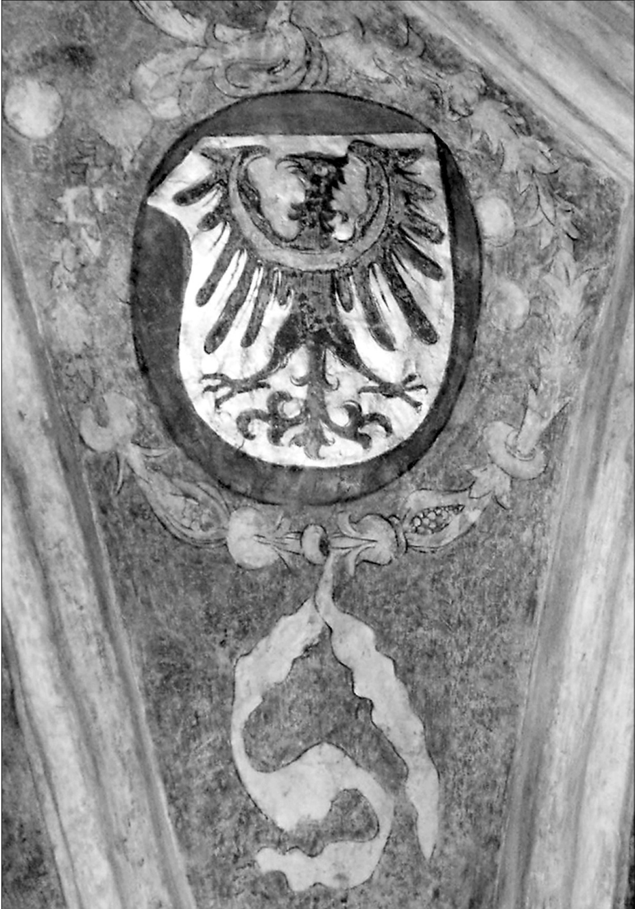
Slezská orlice (na zlatém štítě černá orlice s perizoniem) na klenbě kaple sv. Anny ve fran-tiškánském klášterním kostele v Opolí. Pozdně gotická klenba byla zbudována za života posledního opolského knížete Jana II. Dobrého (†1532), nejspíše kolem r. 1520; r. 2009.