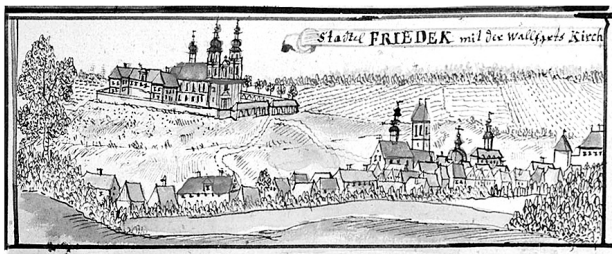
Vyobrazení Frýdku z poloviny 18. století. Z tohoto slezského města na pravém břehu hraniční řeky Ostravice byl proveden 18. února 1741 vpád pruských jednotek do sousedního moravského Místku.

Záhy po odchodu pruské posádky se do fortifikací poblíž Jablunkova vrátily rakouské oddíly, o jejich síle však prameny mlčí. V červnu 1741 vídeňská válečná rada nařídila, aby tamní posádka posílila 40 nově zverbovaných mužů. Podobně měly být posíleny také všechny pohraniční pevnosti v celé oblasti, včetně těch na moravsko-uherské hranici. Všechny měly navíc projít důkladnými opravami, aby