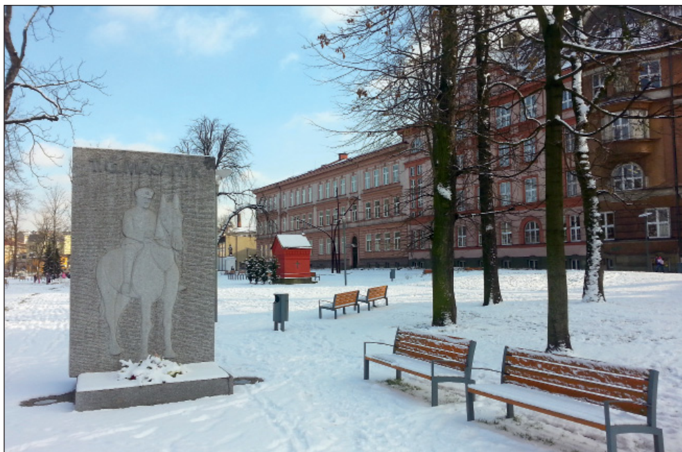
Do Českého Těšína se pomník zakladatele československého státu a prvního prezidenta republiky T. G. Masaryka (v popředí) vrátil v roce 2010 z iniciativy zaměstnanců Muzea Těšínska. Nedaleko pomníku – v budově bývalé učňovské, později hotelové školy – dnes najdeme i správní budovu muzea

Pro orientaci v uvedených číslech připomeňme, že účelově vázané investiční dotace nelze spojovat ani zaměňovat s příspěvkem zřizovatele na vlastní provoz muzea. Nemohou být použity na úhradu běžných provozních nákladů ani mezd zaměstnanců. A zde se již situace, bohužel, nejeví tak optimisticky, jako je tomu u dotací na výstavbu. Provozní náklady byly i v roce 2014 hrazeny především z příspěvku zřizovatele na provoz muzea, jenž byl však ve srovnání s rokem 2013 o téměř dva miliony korun nižší a činil v součtu jen 25 616 000 Kč. Vlastní výnosy organizace byly sice o něco vyšší než v roce 2013 (např. ze vstupného, z prodeje knih, zboží a služeb apod.) a dosáhly 1 022 000 Kč, celkové výnosy organizace byly přesto o téměř dva miliony korun nižší, než tomu bylo v roce 2013, a činily 27 163 000 Kč. Obdobně tomu odpovídaly celkové náklady na chod muzea, které byly v roce 2014 téměř o dva miliony