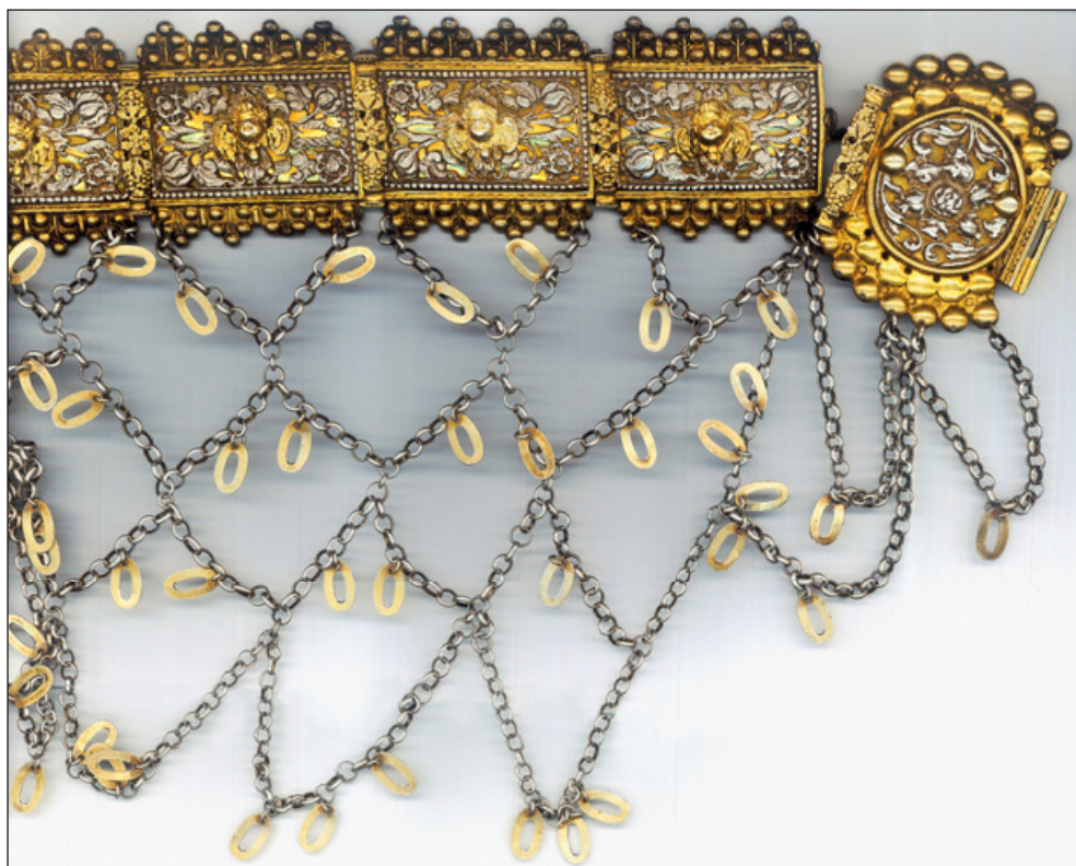
Stříbrný pás k těšínskému kroji z počátku 19. století obohatil sbírky Muzea Těšínska v uplynulém roce