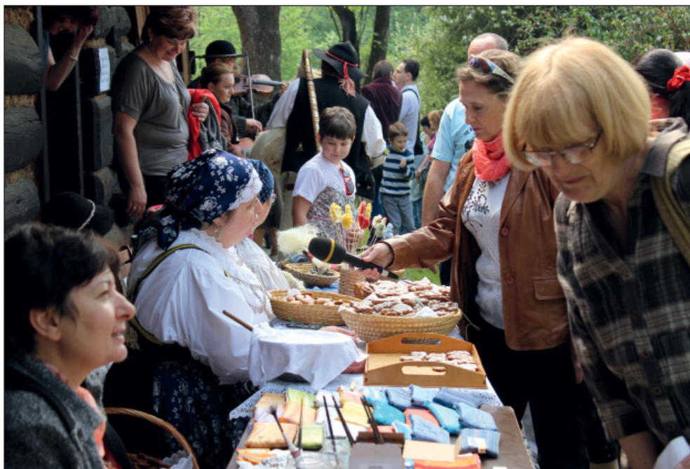
Zahájení sezony v Kotulově dřevěnce, 1. května 2014

Shrneme-li závěrem činnost MT v roce 2014, musíme konstatovat, že byla nadprůměrná i přesto, že nás dlouhodobě trápí absence výstavních prostor i prostor pro práci s dětmi, mládeží a veřejností. Vědecká rada MT na svém výročním zasedání zhodnotila činnost ve srovnání s ostatními muzei působícími v Moravskoslezském kraji jako nadstandardní, a to nejen výstavními počiny a sbírkovou činností, ale i popularizační prostřednictvím nejrozličnějších přednášek a akcí. Rada konstatovala, že co do vědeckého výzkumu, publikačních a edičních výstupů MT daleko převyšuje činnost srovnatelných muzeí v kraji a v posledních letech postupně získává charakter řádné vědecké instituce.