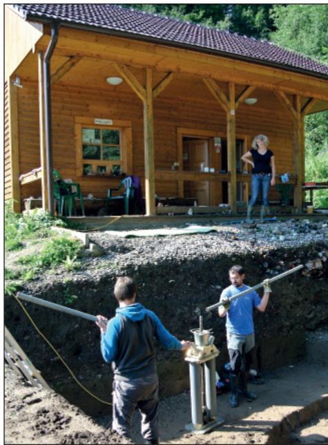
Odebírání geologických vzorků pod budoucím stavenišťem nového vstupního objektu v Archeoparku Chotěbuzi-Podobore