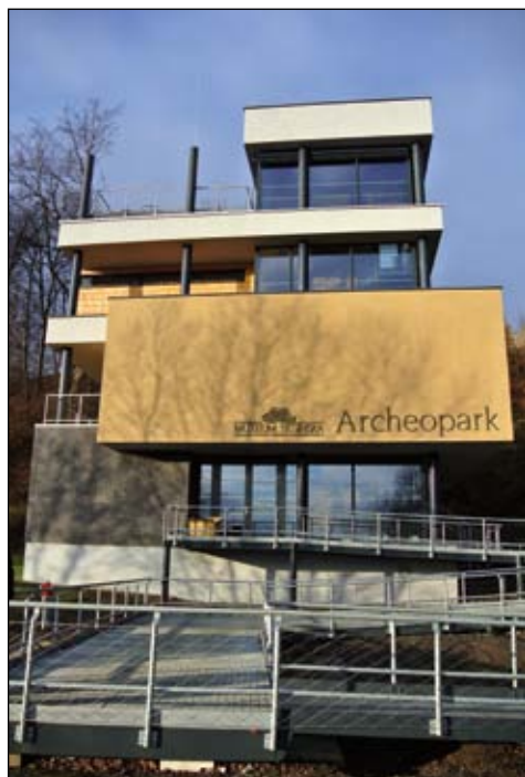
Novostavba vstupní budovy Archeoparku v Chotěbuzi-Podoboře, 7. prosince 2015, Muzeum Těšínska

Na jaře loňského roku byla odstraněna dosavadní provizorní recepce. Následoval nezbytný archeologický průzkum v místech budoucí výstavby, který přinesl zajímavé nálezy, a pak po celý rok 2015 místo obsadili stavbaři. Jejich aktivity zaměstnávaly i muzejníky, každý krok musel být konzultován, hledala se řešení neočekávaných situací, protože projekt nepamatoval zdaleka na vše, např. na připojení budovy na zdroj elektrické