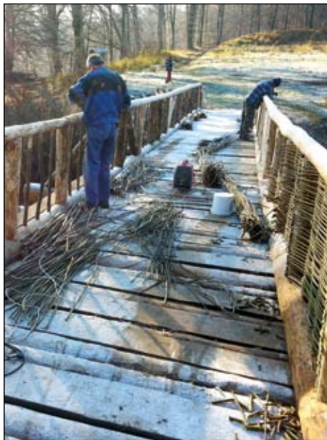
Oprava mostu v Archeoparku, podzim 2015, Muzeum Těšínska

energie. Ač byla elektrická přípojka zakreslena v projektu, ve skutečnosti nikdy neexistovala. Hrozilo zastavení stavby, budova by bez zdroje energie nemohla fungovat. Nakonec se nám úskalí podařilo vyřešit ve spolupráci s několika členy Klubu Muzea Těšínska (dále jen KMT). Problémy však přineslo i budování základů nového objektu a také tzv. lávky v korunách stromů. Ukázalo se, že podloží je na mnoha místech velmi nestabilní a svah nad budovou hrozil sesuvem. A tak několikametrové ocelové piloty, na nichž stojí budova a zejména lávka, byly nakonec zapuštěny místy až šest metrů hluboko do terénu. Lávka sehrává velmi důležitou provozní i didaktickou úlohu. Návštěvníci nejprve vystoupají po schodech nebo vyjedou výtahem až na terasu do třetího patra. Odtud je pak téměř stometrová lávka pomyslně i doslova dovede ze současnosti do minulosti. Je unikátním technickým řešením, které na počátku mnozí odmítali. Dnes jsem rád, že se mi tuto myšlenku podařilo prosadit. Umožňuje totiž nejen snadno překonat 16metrový výškový rozdíl mezi úpatím a hranou tzv. akropole i starším lidem a vozíčkářům, ale zároveň pohlédnout jak na hradisko, tak do přírody v jeho okolí z nezvyklé perspektivy.