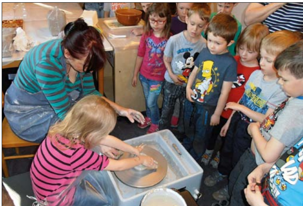
Doprovodná akce pro děti Hrnčířské umění dneška připravená v havířovské výstavní síni Musaion k výstavě Tajemství hlíny

rozhlasu, televize, letáků a příležitostných tisků. Zaměstnanci MT připravili a rozeslali 27 tiskových zpráv, na jejichž základě bylo zveřejněno 251 tištěných článků a elektronických, rozhlasových či televizních reportáží o naší činnosti. Kromě 12 barevných oboustranných letáků k novým výstavám připravili také šest pravidelně vydávaných a rozesílaných dvouměsíčních programů s nabídkou všech aktivit MT, doplněných