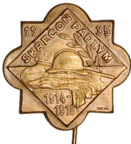
Odznam nalezený při obnově pomníku obětem světových válek v Bohumíně-Skrečoni, Muzeum Těšínska

K mimořádně cenným novým sbírkovým položkám patří soubor předmětů, jež byly nalezeny při obnově pomníku obětem světových válek v Bohumíně-Skrečoni, vybudovaného v roce 1935. Kovový tubus uložený v pomníku skrýval své poklady celých osm desítek let. Dochoval se např. členský průkaz spolku pro postavení pomníku, strojopisný proslov starosty obce pronesený při jeho odhalení 28. října 1935, projevy dalších účastníků, pamětní listina,