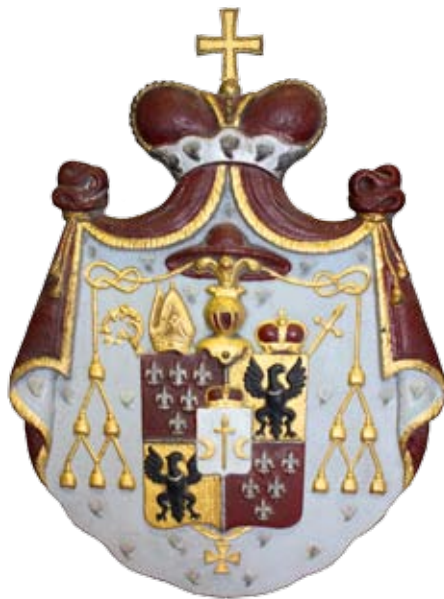
Litinový polychromovaný znak Emanuela Schimonského (1752–1832), vratislavského knížete biskupa v letech 1823–1832, získaný do sbírek Muzea Těšínska v uplynulém roce

náčrtek rozestavení členů spolku a delegací při slavnostním aktu, kovový odznak s jehlicí s nápisem Skřečoň padlým 1935 (1914–1918) a další. Předměty darovalo do muzejních sbírek město Bohumín. Pozornost si zasluhují i některé další získané nové sbírkové předměty – např. vzácný soubor liturgického textilu, původem z filiálního kostela sv. Cyrila a Metoděje na Hřčavě. Jedná se zejména o kněžská roucha, ministrantské textilní součásti (sukně, límce) a o několik antipendií a vlajek. Textilie pocházejí z 50. a 60. let minulého století. Získaná kolekce, kterou doplňují i kropicny, kadidelnice či dřevěný svícen, je významným dokladem nejen k historii regionálního náboženského života lidí, žijících v nejvýchodnější části českého, dříve československého Těšínska. Totéž lze říci i o litinových náhrobních křížích z již nevyužívaného hřbitova v Horních Domaslavicích nebo o unikátních praporech dokumentujících náboženskou spolkovou činnost v minulosti. První z nich, zasvěcený horníkům z domaslavické farnosti, nese vyobrazení sv. Barbory a sv. Anděla Strážného, druhý je spolkovým praporem Svazu katolických žen a dívek v Horních Domaslavicích s podobiznami Panny Marie Růžencové a sv. Anny.