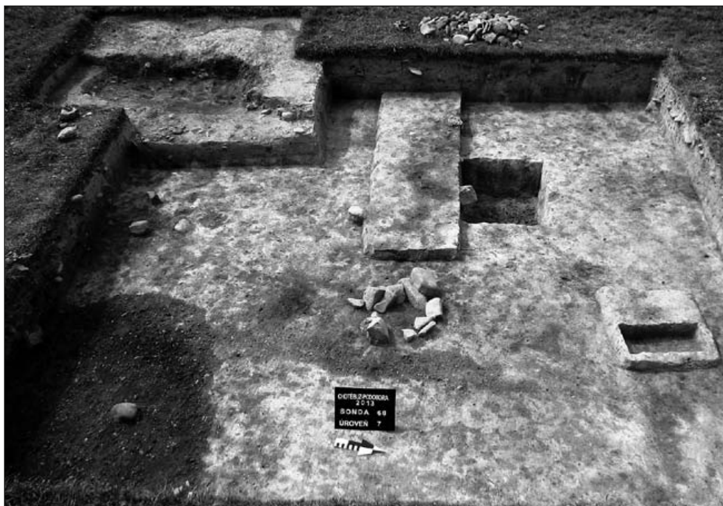
Východní pohled na plochu sondy č. 60 na akropoli hradiska. Na úrovni sedm jsou zachyceny objekty z období halštatského i středohradištního. V jihovýchodním rohu sondy (vlevo dole) se nachází objekt s výrazným tmavočerným zbarvením hlíny. Po celém jeho odkrytí se ukázalo, že se jedná o stavbu s raritně zachovalou dřevěnou podlahou, jež pravděpodobně sloužila k ustájení dobytka

s názvem Justum autem animae in manu Dei sunt , jež se konalo v Akademickém konferenčním centru v Praze. Na této tradiční akci Ústavu dějin umění AV ČR přednesl příspěvek, v němž prezentoval dosud badatelsky opomíjený soubor dochovaných luterských funerálních artefaktů a jejich reziduí vzniklých na území historického Těšínska od 90. let 18. století do roku 1861.