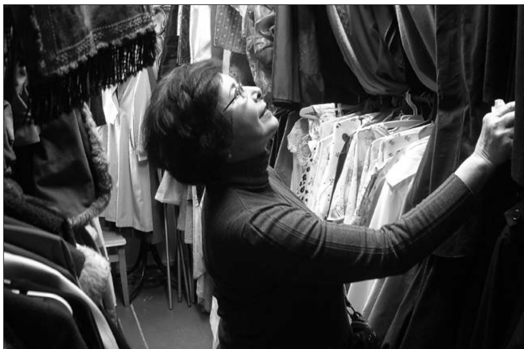
Členové Klubu Muzea Těšínska zavítali během exkurze Těšínského divadla i do skladu kostýmů a dalších provozních prostor, které jsou běžným návštěvníkům nepřístupné, 16. dubna 2013