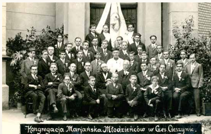
Mariánská družina mládežníků při kostele v Českém Těšíně, foto Wilhelm Pateisky, kolem r. 1925 (Muzeum Těšínska)