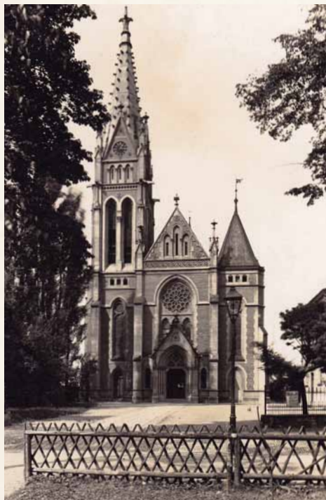
Farní kostel Nejsvětějšího Srdce Ježíšova v Masarykových sadech, 30. léta 20. století (Muzeum Těšínska)

Další z dílů seriálu přibližujícího dějiny našeho města prostřednictvím ukázek z jednotlivých kapitol obsáhlé knihy vydané pod redakcí Radima Ježe, Davida Pindura a Henryka Wawreczky je vybrán z obšírného oddílu věnovaného komplikovanému náboženskému vývoji a církevně-správním poměrům. Úryvek přibližuje nelehké počátky samostatné římskokatolické farnosti Český Těšín.