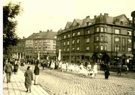
Církevní průvod na Nádražní ulici, 30. léta 20. století