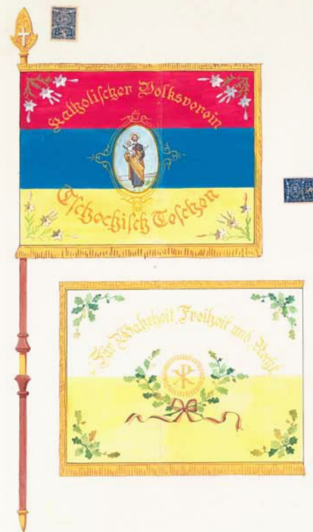
Návrh praporu spolku Katholischer Volksverein für Tschechisch Teschen, r. 1921 (Zemský archiv v Opavě)

Po rozdělení Těšínska i samotného města Těšín připadla fara s farním kostelem sv. Maří Magdalény i většinou dalších církevních objektů Polsku. Těšín naopak museli opustit milosrdní bratři české národnosti, kteří byli dokonce v lednu a únoru 1919 internováni v Dembě u Krakova. Jejich zdejší konvent byl 15. ledna 1921 vyňat z pravomoci československého provinciála a převeden k polské provincii. Na levém břehu Olše se nacházel z významnějších církevních staveb a zařízení pouze chrám Nejsvětějšího Srdce Ježíšova s jezuitskou rezidencí, nedávno postavená dřevěná kaple (Barackenkirchlein) v přilehlém areálu někdejší vojenské nemocnice, Dům sv. Jana sester boromejek na Frýdecké ulici a kostel sv. Hedviky ve Svibici. Kromě toho se zde nacházely dvě malé zděné kaple, tzv. Grabekova kaple (sv. Kříže) z roku 1897 v Albrechtových sadech a pod Červeným dvorem na Brandýse pak starší (tzv. Pinkasova) z roku 1848. Rovněž komunální hřbitov se rozdělením v roce 1920 ocitl v polském Těšíně, na levém břehu byly k dispozici vesnické hřbitovy v Mostech, Svibici a Zpupné Lhotě. Z těšínské farnosti Československu připadly kromě levobřežní části města (v roce 1920 to mělo být 394 domů se