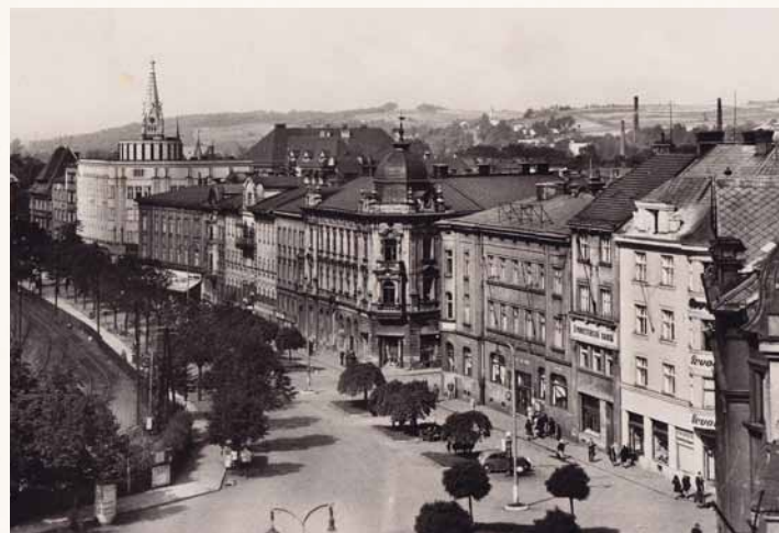
Pohled na sadovou výsadbu na Nádražní ulici (Muzeum Těšínska)

Dosud jediný českotěšínský kostel, římskokatolický kostel Nejsvětějšího Srdce Ježíšova, doplnil v roce 1927 nový kostel Německé církve evangelické (německo-šlonzackého sboru) a v roce 1932 kostel Augsburgské evangelické církve ve východním Slezsku v Československu (polského sboru). Rozvíjela se také