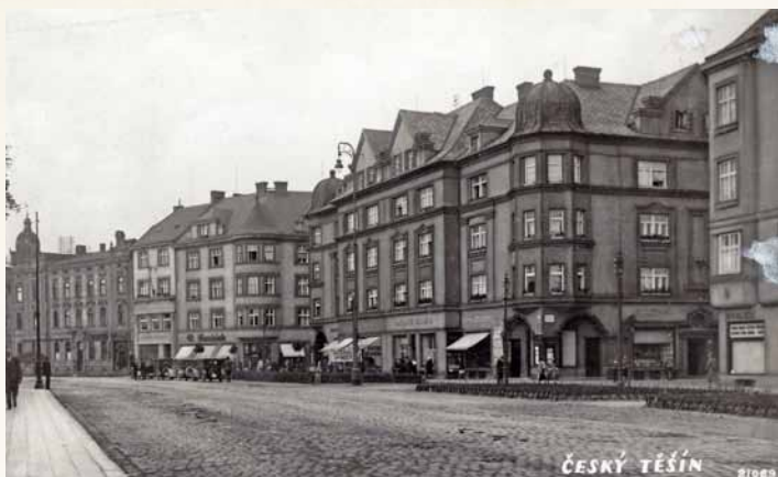
Dům na nároží Nádražní a Bezručovy ulice realizovala Všeobecná stavební a bytová společnost státních zaměstnanců v r. 1925 podle návrhu architekta Eduarda Davida (Muzeum Těšínska)