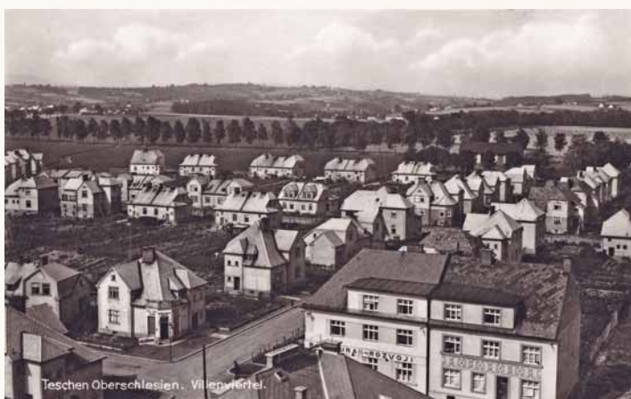
Celkový pohled na zástavbu rodinných domů sídliště Rozvoj, v popředí restaurace Na Rozvoji, naproti obchod smíšeným zbožím