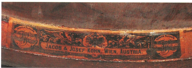
Papierowa etykieta firmy J. & J. Kohn z 1884 r.