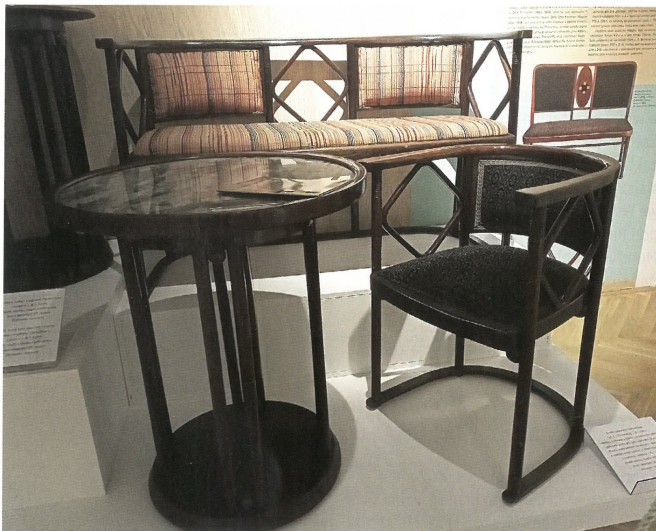
Zestaw wypoczynkowy Josefa Hoffmanna z początku XX wieku, zbiory Muzeum Těšinska