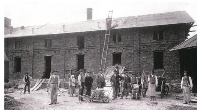
Budowa nowych obiektów fabryki Kohnów w Cieszynie około 1900 r.

Dodaje, że produkcję mebli w czeskokocieszyńskim zakładzie zakończono około roku 1924, chociaż niektóre źródła archiwalne podają rok 1931. Ostatni z czeskokocieszyńskich budynków, w których produkowano