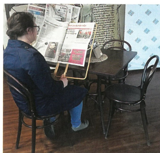
Thonetki w kawiarni Avion