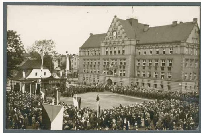
Prezident Tomáš Garrigue Masaryk při své návštěvě v Českém Těšíně, 6. července 1930