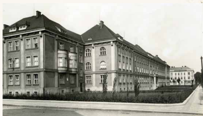
Novostavba trojkřídlé budovy okresního úřadu – tzv. Úředního domu – s hlavním vchodem z Tyršovy ulice byla postavena v letech 1924–1927 firmou Václava Nekvasila a zkolaudována v r. 1929. Autorem projektu byla firma Kolář & Rubý z Moravské Ostravy. V budově kromě okresního úřadu sídlil i okresní soud, prokuratura, notariát, četnická stanice s vyšetřovací vazbou a později též státní policejní úřad zřízený v Českém Těšíně až 14. prosince 1936

Dne 24. září 1920 byla jmenována pro město ze zástupců českých, polských a německých politických stran třicetičlenná správní komise. Na její ustavující schůzi 30. září byl