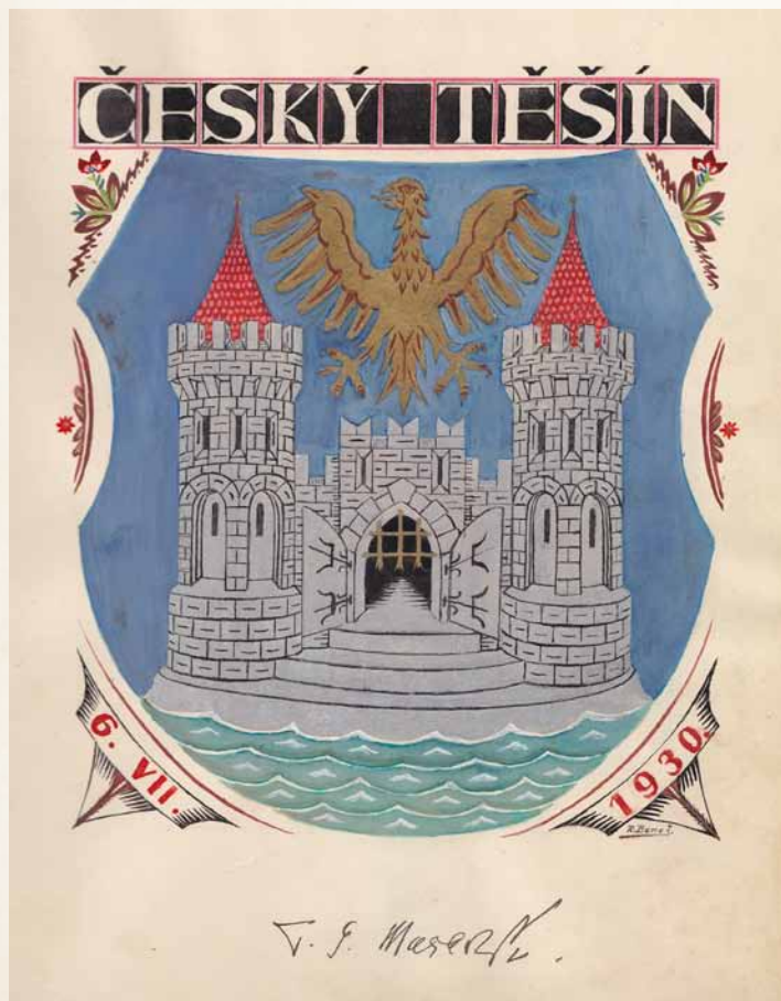
Znak Českého Těšína a podpis Tomáše Garrigua Masaryka v pamětní knize města, r. 1930 (Státní okresní archiv Karviná)