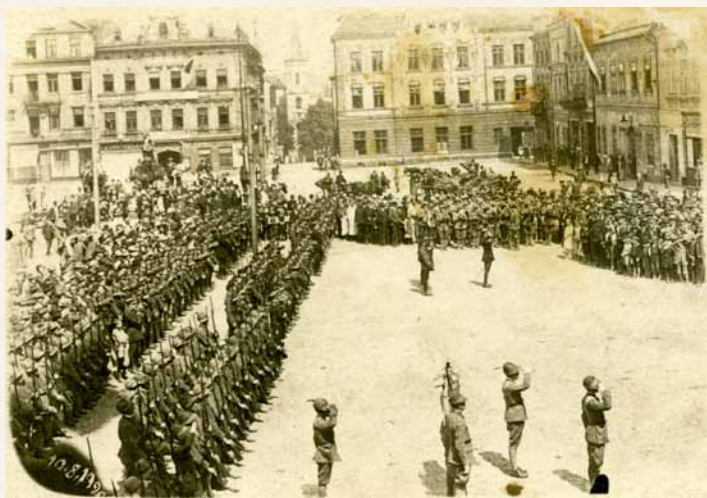
Slavnostní předání rozdělených částí Těšínska československé a polské správě na náměstí v Těšíně 10. srpna 1920

V pokračování seriálu o dějinách Českého Těšína vám tentokrát přinášíme úryvek z kapitoly renomovaného historika Dana Gawreckého, publikovaný před nedávnem ve vydané knize Český Těšín 1920–2020 , ve které jsou přiblíženy samotné počátky města v roce 1920.