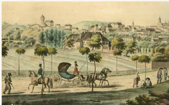
Celkový pohled na Těšín od západu. V popředí uprostřed objekt záměčku na Brandýse, Ludwig Kmetty – Jan Josef Schindler, r. 1819 (Muzeum Těšínska)