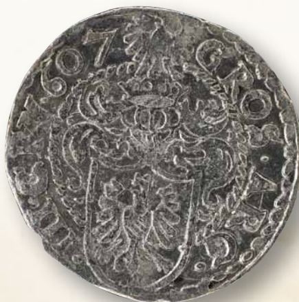
Stříbrný tříkrajcar knížete Adama Václava ražený v těšínské mincovně v r. 1607, průměr 22 mm, váha 1,79 g (Muzeum Těšínska)