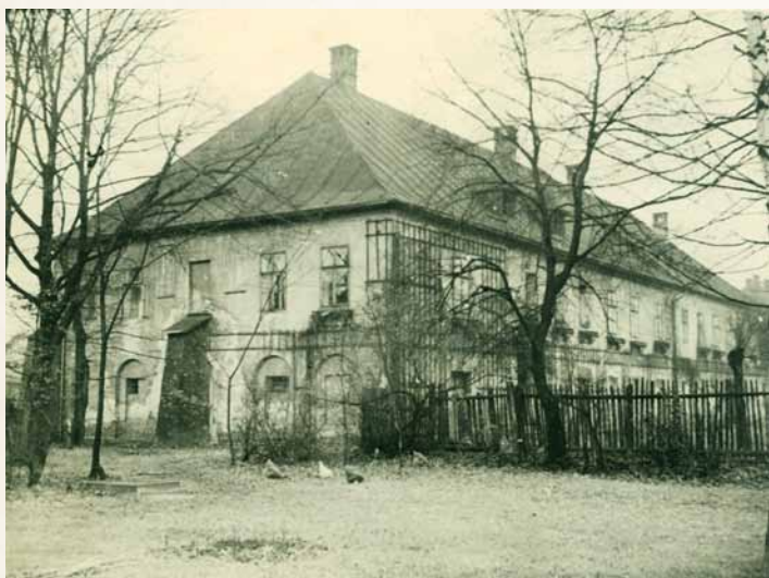
Jeden z objektů areálu hospodářského dvora Těšínské komory na ulici Mánesova, někdejší letní sídlo knížete Adama Václava, kolem r. 1930 (Muzeum Těšínska)

na sklonku středověku velice povolna. S konkrétním označením území levobřežního předměstí Těšína se setkáváme až ve 40. letech 15. století, byť můžeme předpokládat, že zdejší pozemky knížata či jiné osoby využívaly již v předchozím století. Předměstí bylo v torzovitě dochovaných pramenech označováno jako před Těšínem, za Dlouhým mostem či u blejchu a mezi folvarkem knížecím . Víme tak, že areál levobřežního předměstí, jehož zástavba byla až na výjimky značně rozptýlená, začínal na východě na březích Olše, kde stál onen zmiňovaný dřevěný Dlouhý most (zhruba v místech dnešního mostu Družby), pokračoval na jihu až k hranici Svibice, na západě pak sousedil s Mistrovicemi a Mosty a na severu se Zpupnou Lhotou. Na most, který byl prostřednictvím Vodní brány