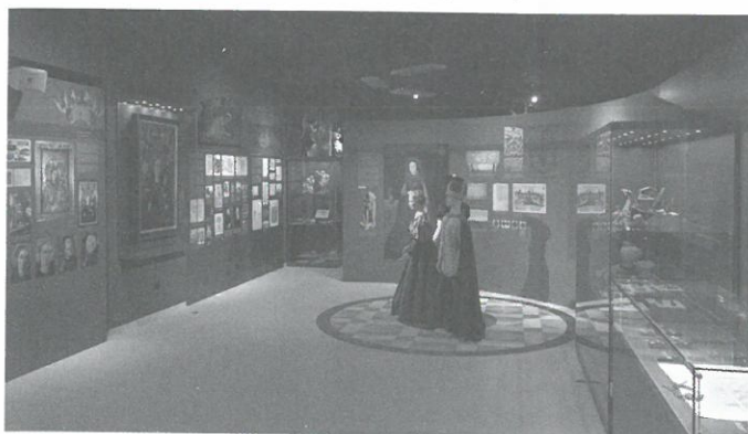
Pohled do stálé expozice, části věnované Těšínskému knížectví ve středověku a raném novověku.

V prvním patře nás nejprve přivítá přírodovědná část věnující se zdejší krajině před příchodem člověka, konkrétně řece a lesu. Zvláště děti uvedená sekce jistě zaujme díky modelům zvířat či nástěnnému metru, který umožní každému