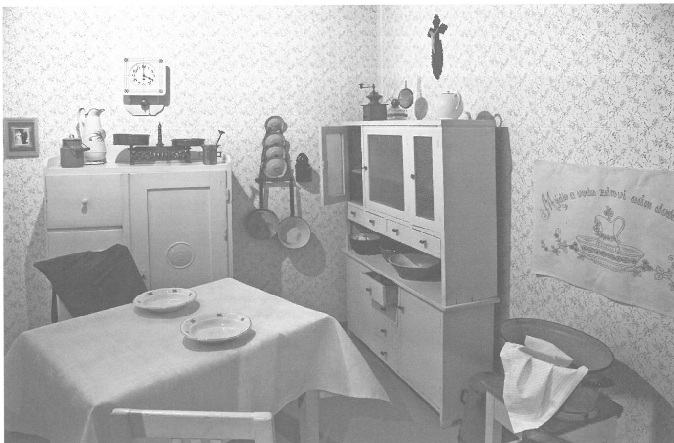
Pohled do části věnované bydlení v hornických koloniích.

Vizuálně velmi atraktivní je sekce věnovaná jednak fotoateliéru se spoustou krásných fotografií, jednak československé kavárně Avion a kultuře první republiky. Můžeme se zde posadit ke stolu a digitálně si zalistovat v některých dobových pozvánkách či fotografiích. Následuje část zasvěcená první návštěvě Tomáše Garrigue Masaryka na Těšínsku v roce 1930, opět působivě doplněná autentickými filmovými záběry. Bohužel také zde celkový dojem malinko kazí větší rychlost promítání jednotlivých záběrů a popisek. Procházku nejnovějšími dějinami završuje náhled do vývoje krajiny na Těšínsku za posledních 100 let, kde si lze řadu poutavých informací opět vyhledat na dotykovém panelu. Za povšimnutí dále stojí fotografie dokumentující demolici řady objektů v důsledku důlní a průmyslové činnosti člověka.