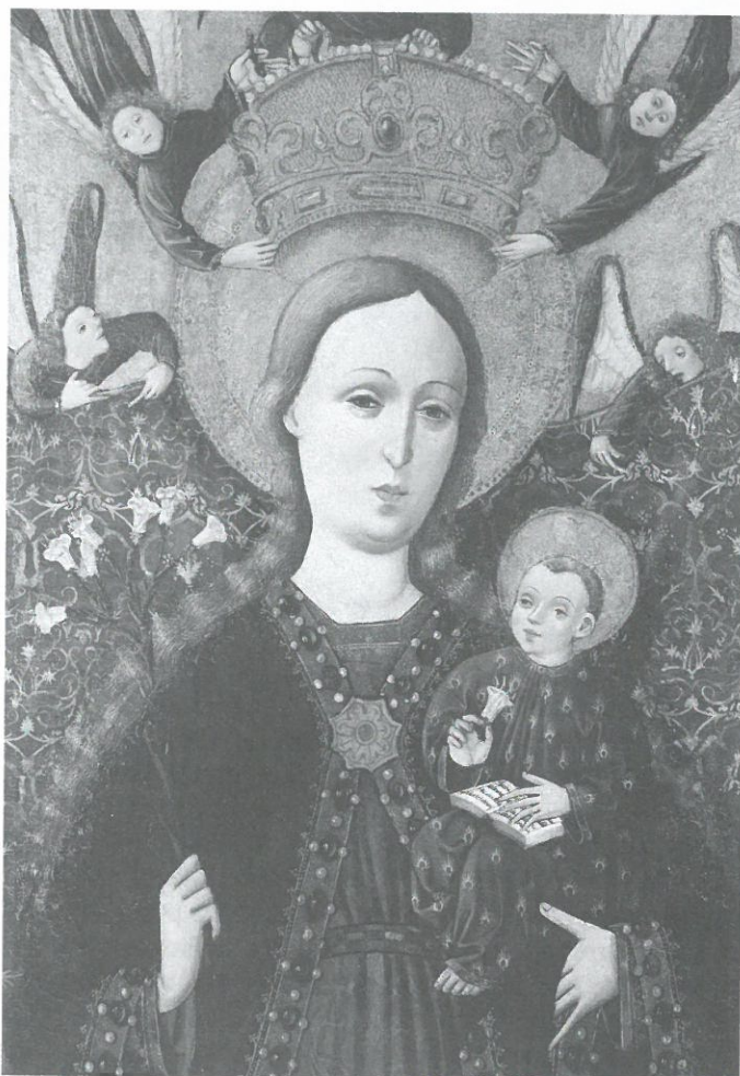
Jedním z nejvýznamnějších exponátů je pozdně gotická desková malba madony z Těrlicka.

V novodobé části expozice návštěvníka zcela jistě zaujmu