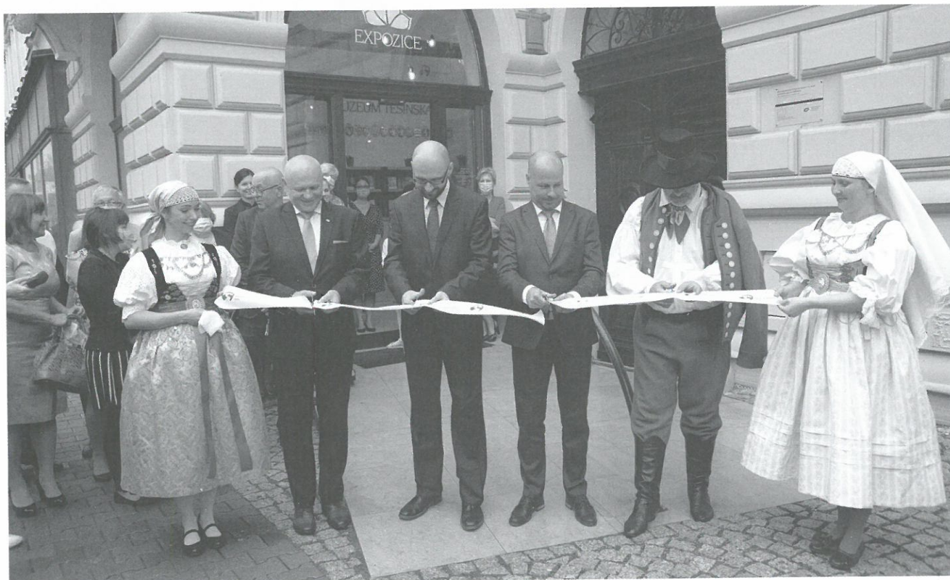
Slavnostní otevření rekonstruované muzejní budovy a nové stálé expozice, 19. června 2020.

Dne 19. června 2020 se vernisáží otevřela zájemcům nová stálá expozice Muzea Těšínska nazvaná Příběh Těšínského Slezska . Tímto významným počinem se muzeum po dvaadvaceti letech vrátilo do reprezentativní budovy na Hlavní třídě v Českém Těšíně, kde sídlilo od roku 1951 a odkud muselo odejít kvůli nedořešeným restitučním nárokům. Objekt, sloužící původně jako obytný dvojdům, v jehož přízemí a na dvoře byly provozovány různé obchody a živnosti, prošel v letech 2017–2020 nákladnou rekonstrukcí, což umožnilo vytvořit na místě zcela novou, moderní expozici, jež se snaží přiblížit návštěvníkovi region Těšínska z mnoha úhlů pohledu. Nová expozice se nevěnuje pouze historii, ale i etnografii, umění, technice či přírodovědě. Velkou měrou jsou při prezentaci využívány multimediální technologie a interaktivní prvky, což umocňuje prožitek z procházení areálem.