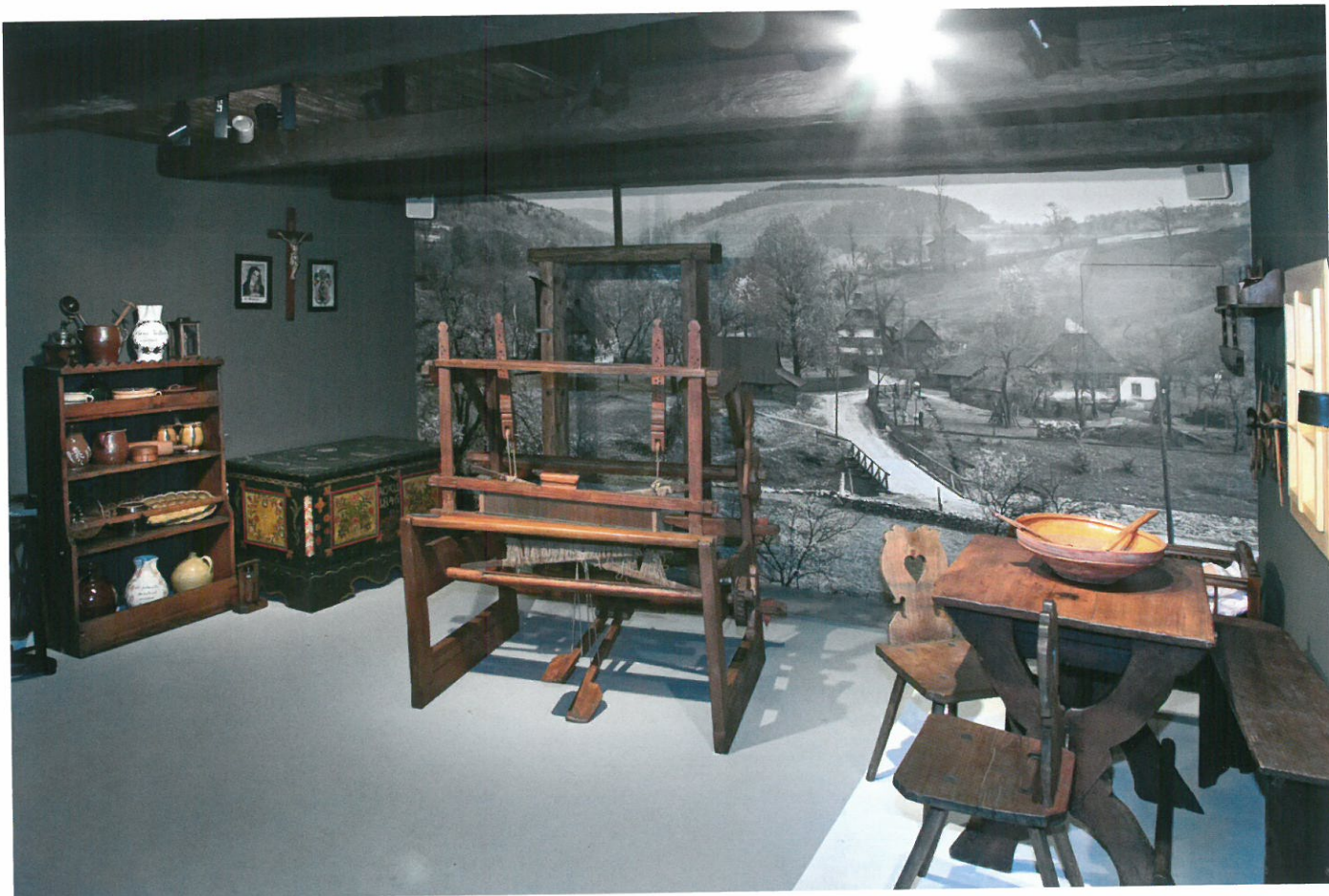
Ukázka z nové stálé expozice Muzea Těšínska – selská usedlost. K článku „Příběh Těšínského Slezska – nová stálá expozice Muzea Těšínska“