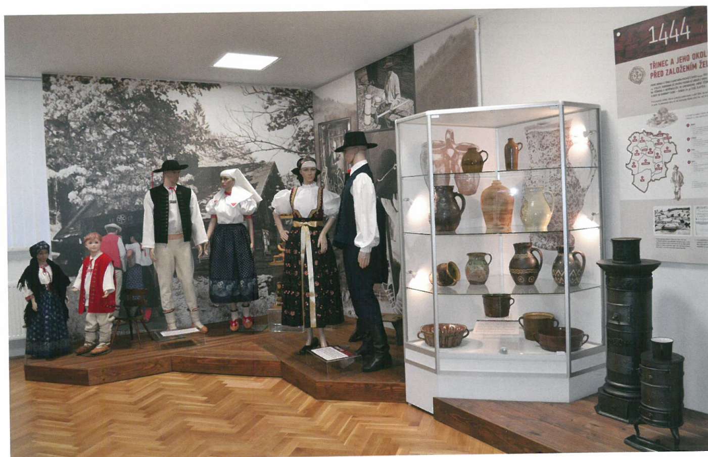
Ukázka z nové stálé expozice Muzea Třineckých železáren a města Třince. K článku „Muzeum Třineckých železáren a města Třince a jeho nová stálá expozice“