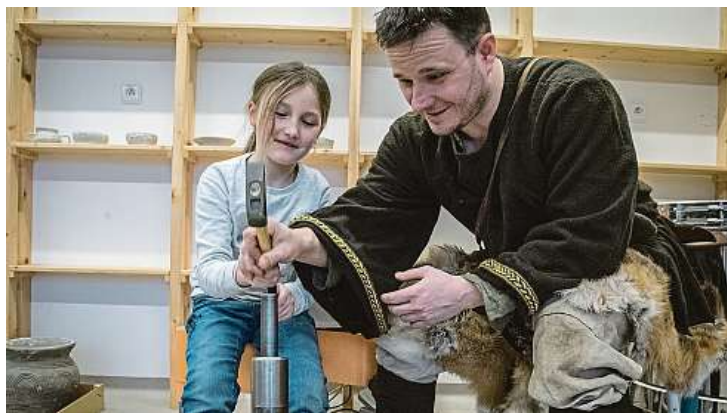
Lidé na webu hledají i aktuální program muzeí.