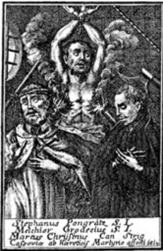
Vyobrazení mučení Grodeckého, Křižina a Pongráče ve církevní historii Kornela Hazarta vydané ve Vídni roku 1703

12.–15. října 1905. Byly skutečným holdem katolíků Rakouského Slezska svému rodákovi. Slavnosti organizovali