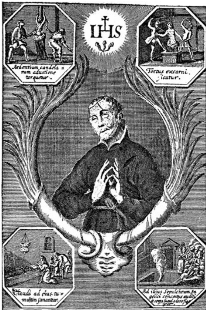
Barokní mědirytina znázorňující Melichara Grodeckého, jeho násilnou smrt a osud ostatků

V letošním roce si připomínáme 400 let od mučednické smrti těšínského rodáka svatého Melichara Grodeckého. Narodil se roku 1584 (uvádí se také rok 1582). Obyvatelé města stejně jako celého Těšínského knížectví byli tehdy většinou luterského vyznání. Vládla zde Sidonie Kateřina, vdova po Piastovci Václavu III. Adamovi. V roce 1595 se ujal vlády v Těšínském knížectví jejich syn Adam Václav, který