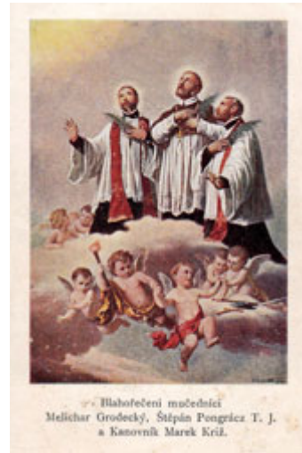
Jiná varianta tisku české verze písně k Melicharu Grodeckému vydané v Těšíně roku 1905 (Muzeum Těšínska)

chrámu, kde rovněž proběhlo svátostné požehnání a zpěv Te Deum. Tato událost se později stala základem tradice zdejších procesí ke cti sv. Melichara.