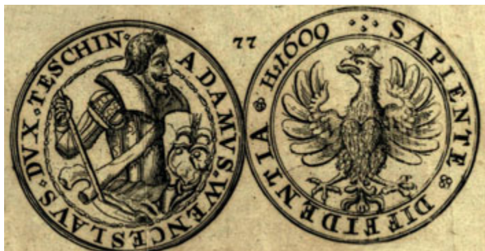
Avers a revers stříbrného tolaru těšínského knížete Adama Václava (1574–1617), jenž byl ražen v těšínské mincovně v roce 1609. Tělož roku tento Piastovec opustil luterské vyznání a stal se katolíkem