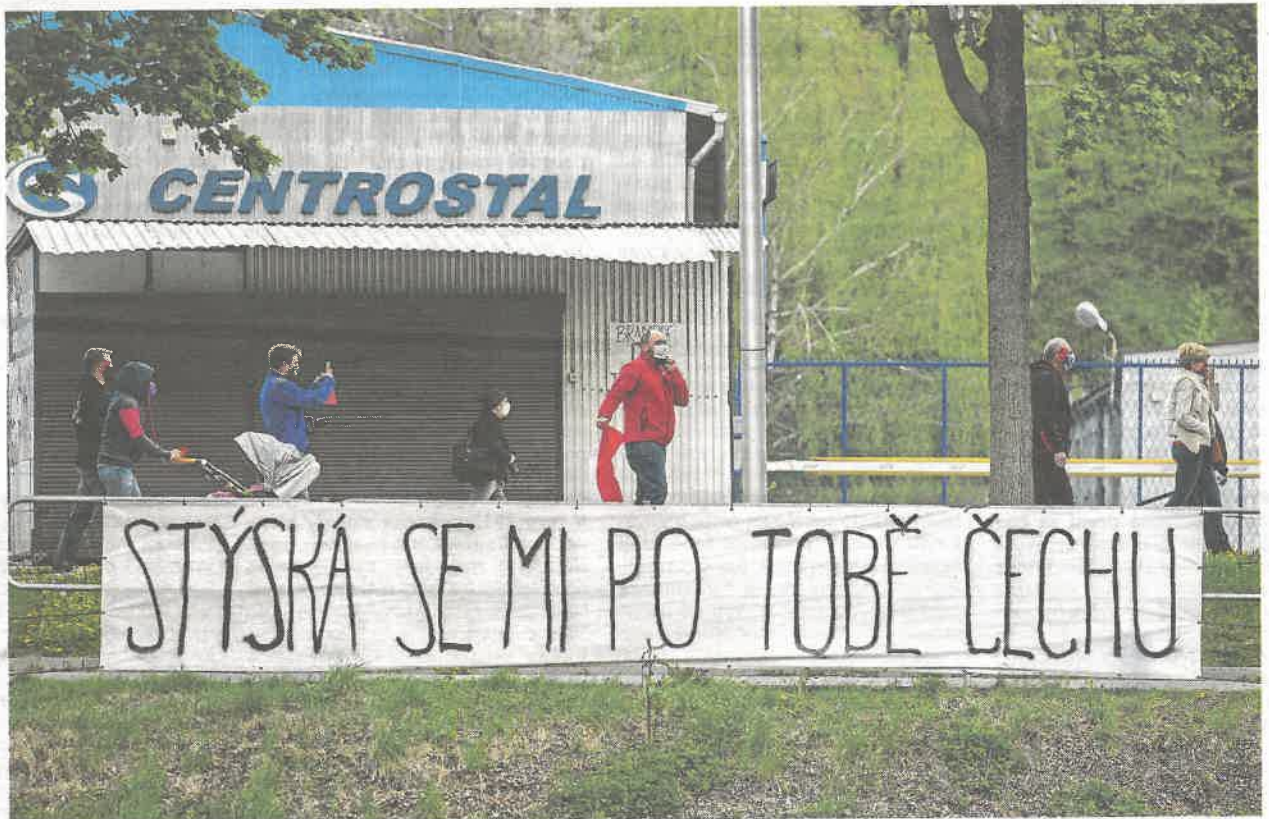
KONTAKT NA DÁLKU VZKAZ Z POLSKÉHO TĚŠINA DO ČESKÉHO BĚHEM LOŇSKÉHO COVIDOVÉHO ZAVŘENÍ.

Vymaní ze Česka ze stávající pandemie? Kdy, zda a jak může dojít k pomyslnému světlu na konci tunelu? Jak krize zasáhla Český Těšín?