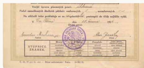
Zápatí vysvědčení vydaného Občanskou školou smíšenou v Českém Těšíně 28. června 1926. Na jeho základě žák první třídy nepostoupil do dalšího ročníku, a tak jej musel opakovat

o povolení provozu pětileté měšťanské školy s polským vyučovacím jazykem. Ve školním roce 1925/26 byla otevřena jedna třída pro 35 dětí, o rok později už byla školou trojtřídní. Po otevření nové budovy počet žáků vzrostl na 144. Od roku 1928 škola nesla jméno Antoniho Osuchowského (1849–1928), neúnavného polského národního aktivisty a předsedy hlavního výboru Matice školské ve Varšavě. Ve školním roce 1928/29 byla zahájena činnost školní jídelny a v lednu 1930 došlo k otevření tělocvičny. Rekonstrukce školní budovy proběhla již v roce 1937/38. Počet žáků se na obecné škole pohyboval kolem 80–90 a na měšťance kolem 200. Například v roce 1926/27 jich bylo 231 a o deset let později 217.