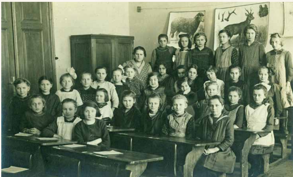
Žačky v učebně českotěšínské české obecné školy, kolem r. 1925