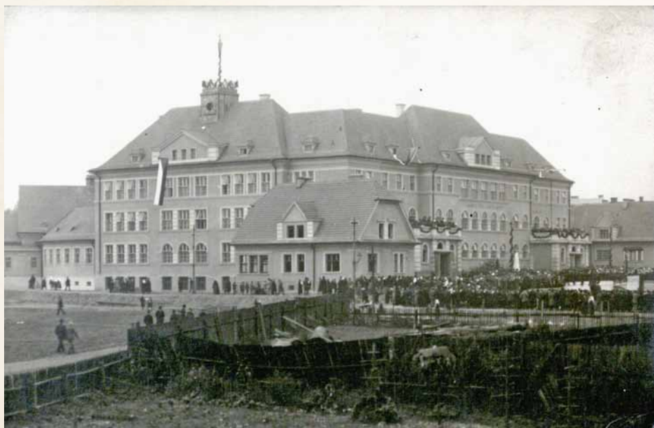
Slavnostní otevření české obecné a měšťanské školy na Mechové (dnes Komenského) ulici, v rámci programu byl odhalen i pomník Tomáši Garriguu Masarykovi, 28. října 1924