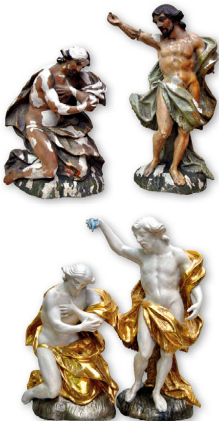
Sousoší Kristova křtu, dnes jeden ze skvostů nové stále expozice Příběh Těšínského Slezska, stav před a po restaurování

V rámci programu Podpory rozvoje muzejnictví 2019 bylo díky finanční podpoře MSK zrestaurováno sedm sbírkových předmětů.