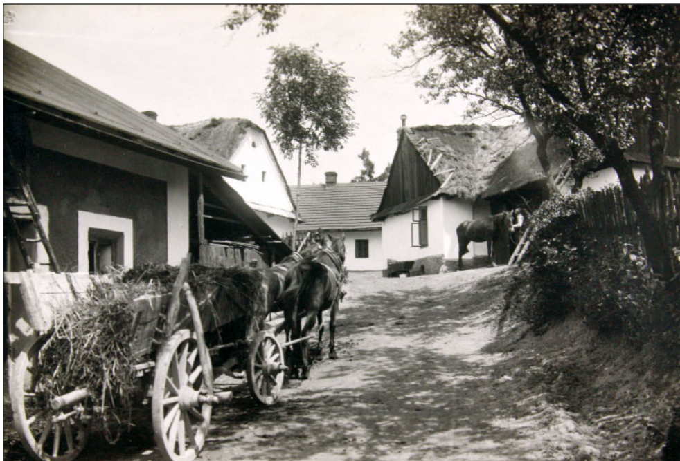
Dnes již neexistující statek selského rodu Žebráků č. p. 17 v Heřmanicích

Zvlášť složitá situace panovala v minulosti na území Těšínského Slezska. Jazyk a kultura