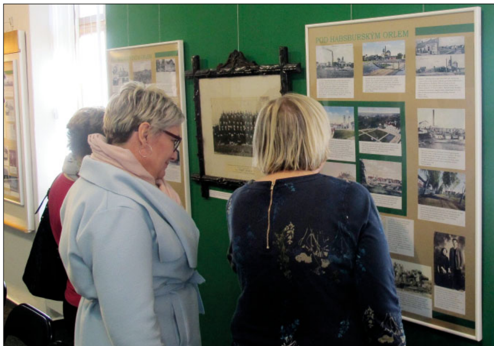
Vernisáž výstavy Obrázky z dějin Petřvaldu , která byla zároveň poslední výstavou v prostorách Technického muzea Petřvald, 7. března 2019

26 526 si prohlédlo výstavy v prostorách MT a 763 v prostorách mimo MT, např. na zámku v Paskově, kde byla společně s městem Paskov představena panelová část naší výstavy Gutský kostel ve vzpomínkách .