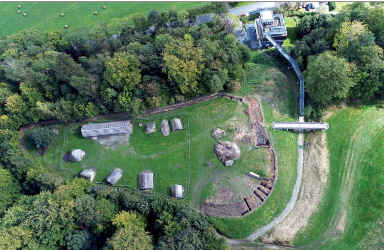
Letecký pohled na areál Archeoparku v Chotěbuzi-Podoboře s akropolí během rekonstrukce palisády a vstupní věže a multifunkční budovou, jež byla veřejnosti zpřístupněna v r. 2016, 29. září 2018

Je třeba připomenout, že v roce 2018 zahájilo MT také realizaci třetího, dosud nezmíněného velkého investičního projektu, jehož cílem je celková revitalizace dřevostaveb, zejména fortifikací, v areálu Archeoparku v Chotěbuzi. Ve skutečnosti se jedná o opravu, ale podstatné je, že také na tuto akci se nám podařilo získat nemalé finanční prostředky z dotací EU. Ale na rozdíl od rekonstrukce výstavní budovy a vybudování nových expozic v Českém Těšíně a vybudování Muzea trojmezí v Jablunkově je financována z integrovaného operačního programu přeshraniční spolupráce ČR–PR. Jedná se o společný projekt s polským partnerem – těšínskou obcí Hažlach. Všechny tři velké projekty jsou předfinancovány zřizovatelem MT, Moravskoslezským krajem, následně